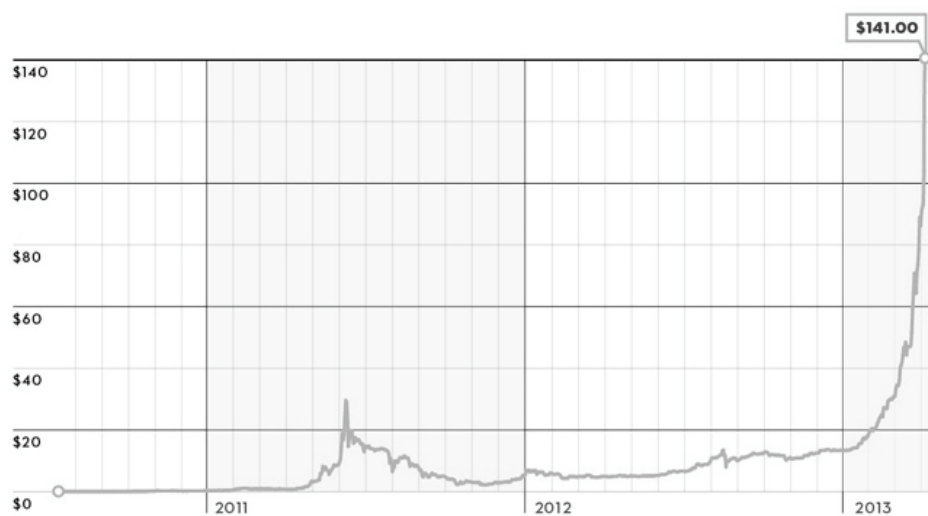
Рис. 2. Динаміка курсу Bitcoin з 2010 по 2013 р. 40